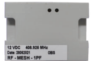
Module RF 1 PHA