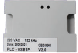
Module PLC 1 PHA